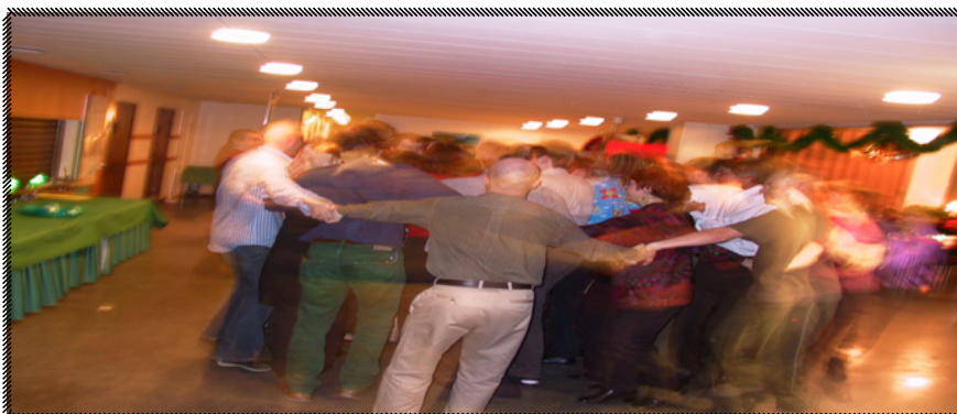
Kulkuetanssi pikkujoulujuhlissa vuonna XIX.